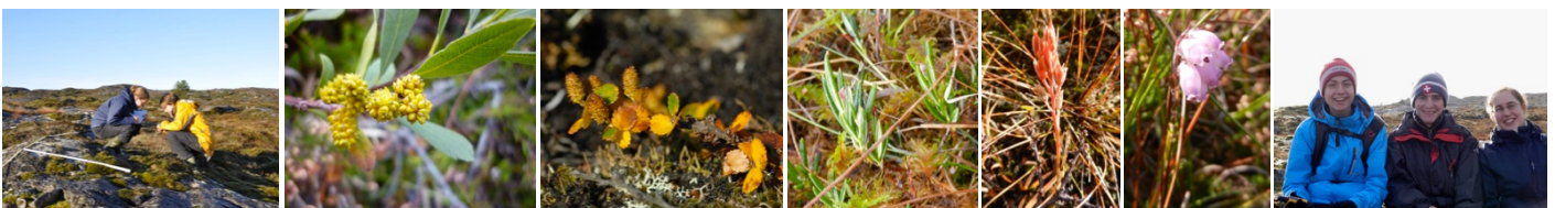
Abb. 4: Von links nach rechts; Transekt durch die Heide-Moor-Landschaft zur Erfassung der Pflanzen und deren Lebensraum; Gagelstrauch ( Myrica gale ) ; Zwergbirke ( Betula nana ) ; Rosmarinheide ( Andromeda polifolia ) ; Beinbrech ( Narthecium ossifragum ) ; Glockenheide ( Erica tetralix ) ; Projektgruppe.