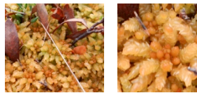
Abb. 2: Links; Torfmoose bilden einen Teppich, darin wachsen weitere Pflanzen. Rechts; Die Torfmoose gleichen von oben betrachtet der Form von Edelweissblüten.