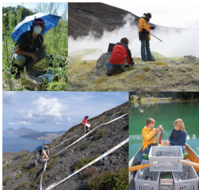
Feldarbeit am Tagliamento (2006, oben links), auf Vulcano (2008, oben rechts und unten links) und im Engadin (2007, unten rechts).

Jedes Jahr führt die academia als Höhepunkt eine Studienwoche in einem ausgewählten Forschungsgebiet durch. Während dieser Woche forschen die Teilnehmer an einem von ihnen speziell ausgesuchten Gruppenprojekt. Die Resultate werden in Postern an einem Präsentationsabend und auch als schriftlicher Bericht ausgearbeitet.