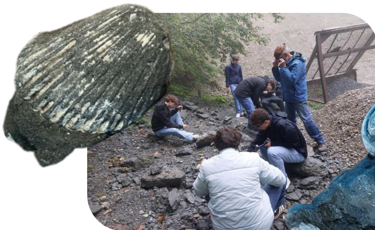
St. Georgen, St. Gallen

Am Morgen konnten wir in einem Steinbruch selbst Fossilien suchen und aus dem Stein meisseln (Bild links).