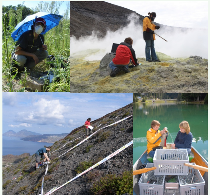
Feldarbeit am Tagliamento (2006, oben links), auf Vulcano (2008, oben rechts und unten links) und im Engadin (2007, unten rechts).

Jedes Jahr führt die academia als Höhepunkt eine Studienwoche in einem ausgewählten Forschungsgebiet durch. Während dieser Woche forschen die Teilnehmer an einem von ihnen speziell ausgesuchten Gruppenprojekt. Die Resultate werden in Postern an einem Präsentationsabend und auch als schriftlicher Bericht ausgearbeitet.